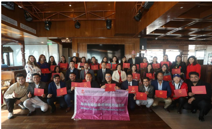
▲尼泊尔旅游业管理海外研修班

项目积极拓展国际合作维度，与旅游管理专业协同申报并成功执行了“尼泊尔旅游业管理海外研修班”援外培训项目。该项目面向尼泊尔旅游业从业人员，系统输出中国旅游管理与智慧运营经验，进一步提升了学校在“一带一路”国家的专业影响力与教育服务能力。