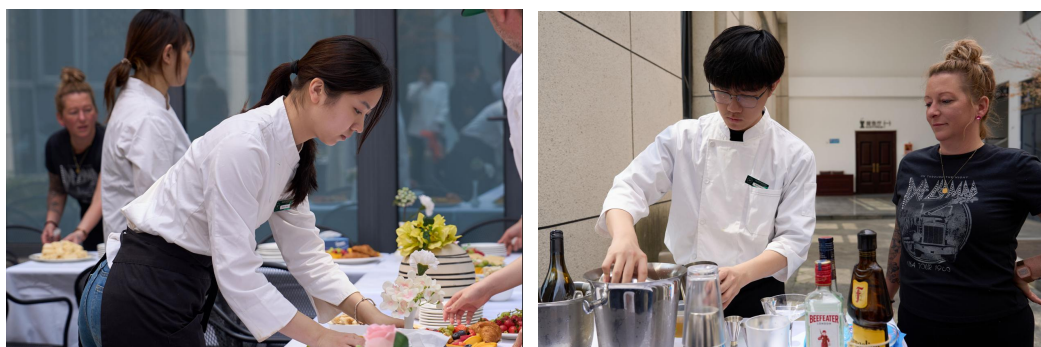
▲ 《西厨运营与管理》《餐饮管理与实务》课程结课展示