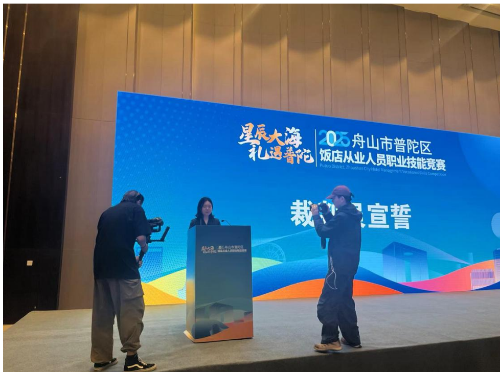
▲专业教师担任行业技能竞赛裁判