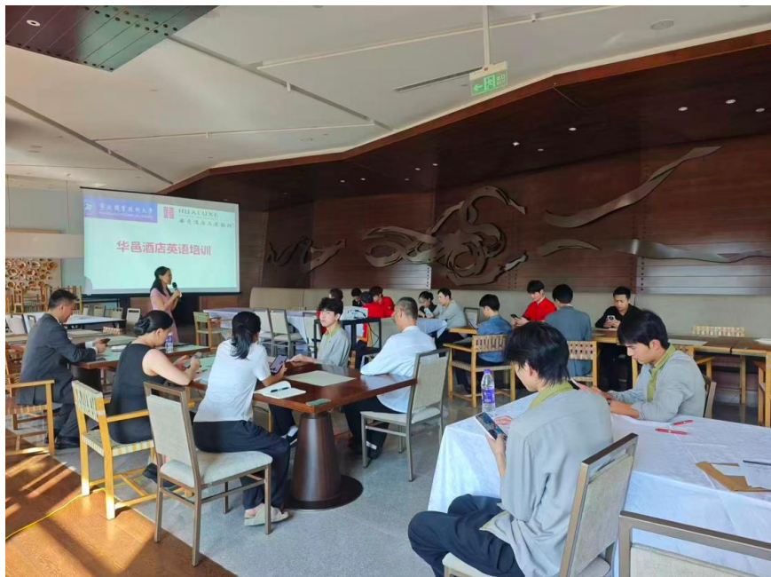
▲专业教师为企业员工培训