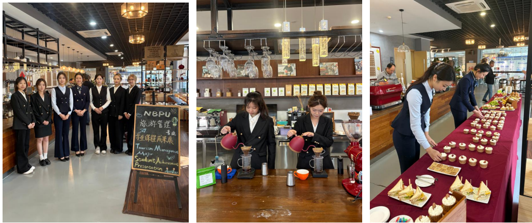
▲ 真实项目中检验技能